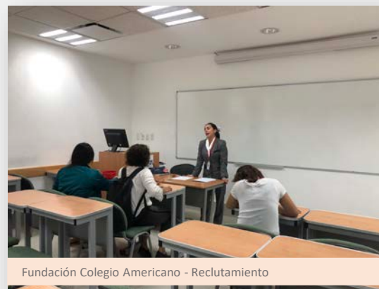
Fundación Colegio Americano - Reclutamiento