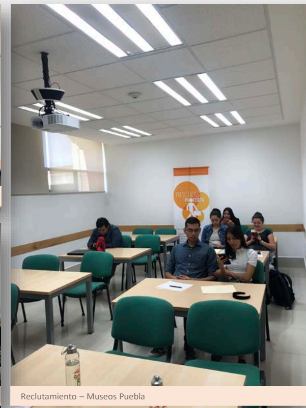
Reclutamiento - Museos Puebla