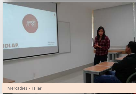
Mercadiez - Taller